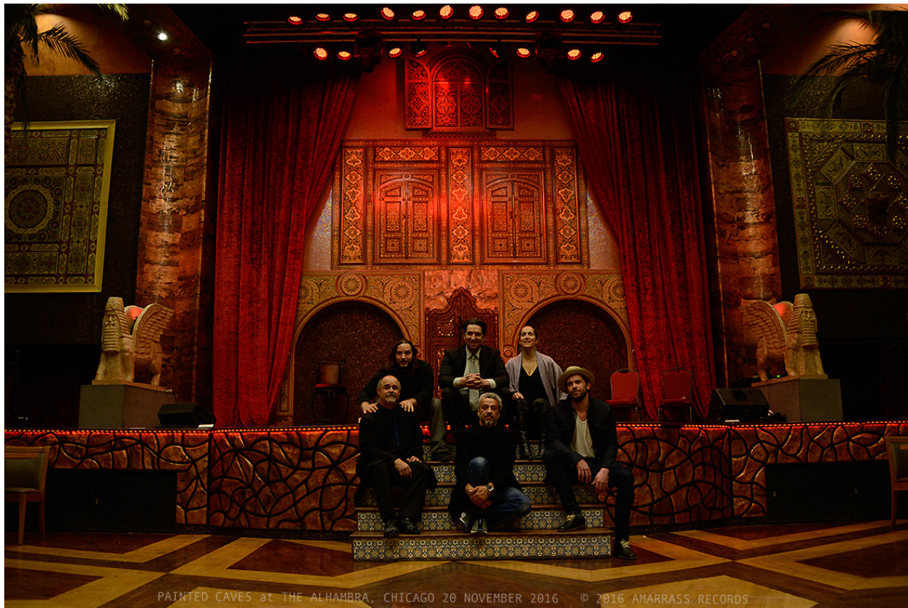
PAINTED CAVES at THE ALHAMBRA, CHICAGO 20 NOVEMBER 2016